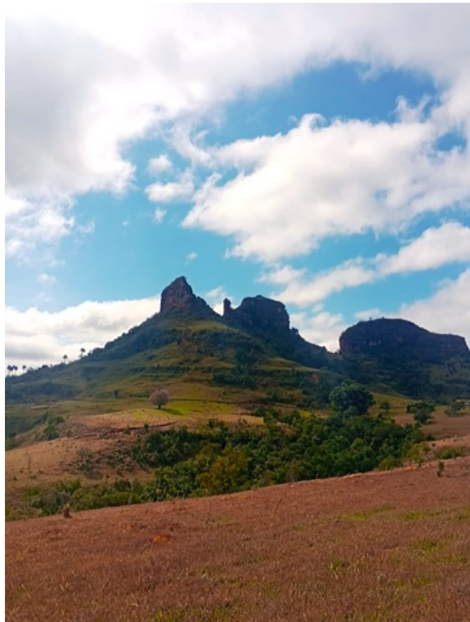
Imagem 02. Morro das Três Pedras.