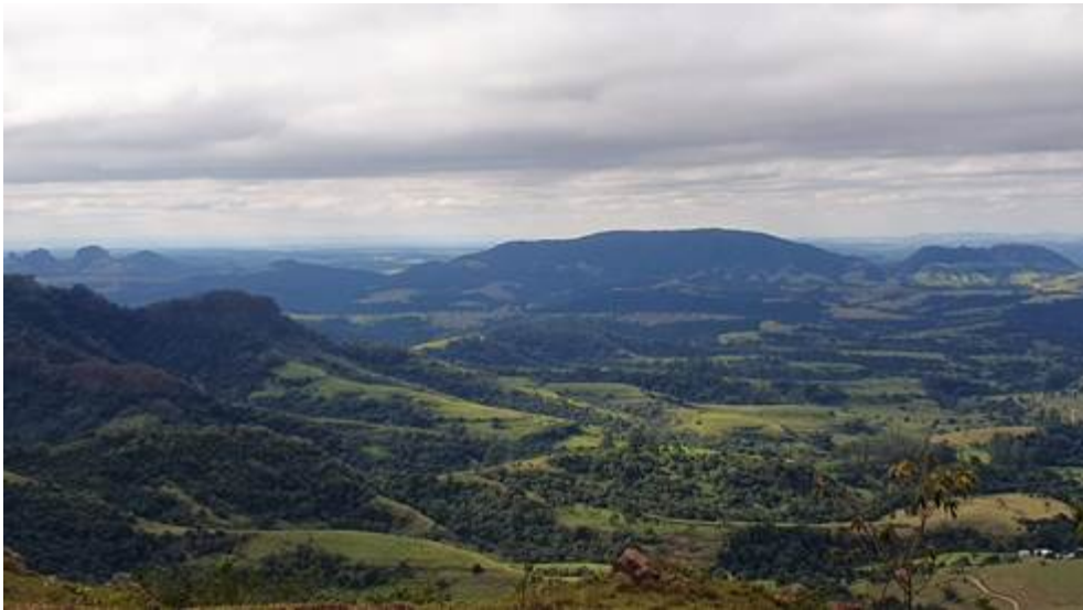
Imagem 01. Paisagem composta pelos morros que constituem o Gigante Adormecido.