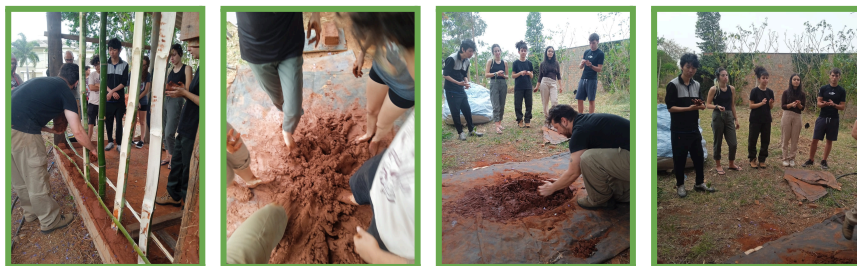
Imagens 1 a 4. Atividade prática realizada em outubro de 2024 (1) Elaboração da estrutura para a taipa de mão; (2 e 3) Preparo da massa para a taipa de mão; (4) teste de consistência da massa.

Além dessas atividades regulares, o espaço tem sido um importante parceiro no município de Botucatu. Nesse sentido, expresso o meu apoio à manutenção e fortalecimento do Jardim Amarelo como essencial para o desenvolvimento de práticas produtivas sustentáveis e como espaço não-formal para atividades educativas.